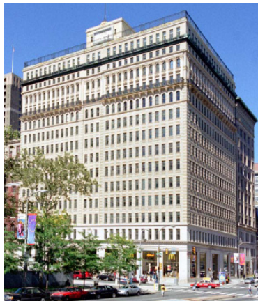
One City Plaza/1401 Arch Street, Philadelphia