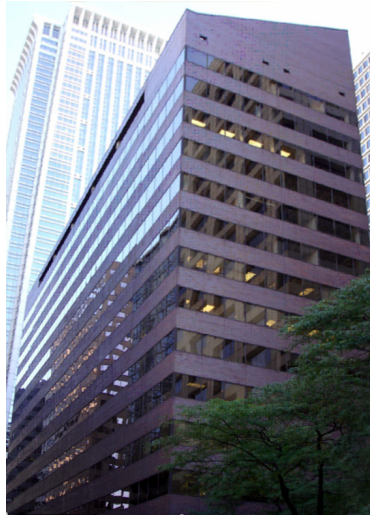
1760 Market Street, Philadelphia

Une sélection de nos dernières acquisitions :