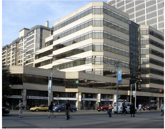
250 Dundas Street, CBD Toronto