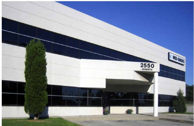
2550 Argentinia Road, Mississauga (Greater Toronto Area)